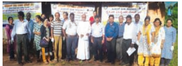
ಉಡ್ಡಿ ದಿಯೆಸೆಚ್ಯಾ ಸರ್ವ್ ಕರ್ಣಾಲಿಕ್ ಸಭಾ ಘಟಾಕಾಂನಿ ನಿರ್ಮಲ್ ಪರಿಸರ್ ಆಂದೋಲನಾಂತ್ ಪಾತ್ ಘೆವ್ನ್, ಅಕ್ಟೋಬರ್ 2ವೆರ್ ಮಹಾತ್ಮಾ ಗಾಂಧಿ ಜಯಂತಿ 150 ಉತ್ಸವ್ ಆಚರಣ್ ಕೆಲೊ.

ಸೊಂಪನಾ, ಬಗರ್ ತೆಂ ಬದಲ್ತಾ ದೆಕುನ್, ಮರ್ಣಾ ಮುಕಾಂತ್ ಆಮ್ಚೆಂ ಜಿವಿತ್ ಬದ್ಲುಂಕ್ ಆನಿ ಸಾಸ್ಣಾಚ್ಯಾ ಸಾಸ್ಣಾಕ್ ಸರ್ಗಿಂಚ್ಯಾ ರಾಜಾಂತ್ ಜಿಯೆಂವ್ಚೊ ಅತ್ರೆಗ್ ದೊಡೊ ಕರುಂಕ್, ನವೆಂಬರ್ ಮಹಿಮಾಚಿ ಪಯ್ಲಿ ಆನಿ ದುಸ್ರೆ ತಾರಿಕೆಚಿಂ ಫೆಸ್ತಾಂ ಆಮ್ಕಾಂ ಆಧಾರ್ ಜಾತಾತ್. ಪೂಣ್ ಹೆಂ ಚಿಂತಪ್ ಫಕತ್ ತ್ಯಾ ಫೆಸ್ತಾಂಕ್ ಮಾತ್ ನ್ಹಯ್, ಬಗರ್ ಅಖ್ಯಾತ್ ದೇವ್ ಸ್ತುತಿಚ್ಯಾ ವರ್ಣಾಂತ್, ಮ್ಹಣ್ಲೆ ದಿಸ್ಪಡ್ತೆಂ ನಿಯಾಳ್ಚಾರ್ ಆಮ್ಚ್ಯಾ ಸಂಸಾರಿ ಜಿವಿತಾಚೊ ಶೆವಟ್ ಆಮ್ಕಾಂ ಸ್ಪಷ್ಟ್ ಜಾತಲೊ ಆನಿ ಸರ್ಗಿಂಚೊ ಅತ್ರೆಗ್ ಆಮ್ಚ್ಯಾ ಸಂಸಾರಿ ಜಿವಿತಾಕ್ ಅರ್ಥ್ ದಿತಲೊ. ದೆಕುನ್, ನವೆಂಬರ್ ಮಹಿಮಾ ಆಮ್ಕಾಂ ಮೊಗಾಚೊ ಜಾಂವ್ ಆನಿ ಏಕ್ ದೀಸ್ ಸರ್ಗಿಂಚ್ಯೆ ಪವಿತ್ರ ಸಭೆಚೆ ಮಹಿಮೆಂತ್ ವಾಂಟೆಲಿ ಜಾಂವ್ಕ್ ತೆಂ ಪ್ರೇರಣ್ ಜಾಂವ್.