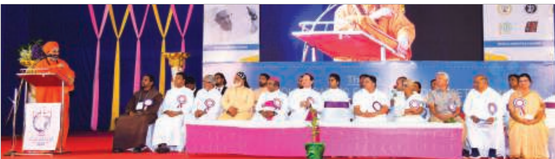
ಕರ್ನಾಟಕ್ ರಾಜ್ಯಾಚ್ಯಾ ಪಾಂವ್ಡಾರ್ “ಯುವಜನೋತ್ಸವ-2019” ಬಳ್ಳಾರಿಂತ್ ಅಕ್ಟೋಬರ್ 24 ಥಾವ್ನ್ 27 ಪರ್ಯಾಂತ್ ಚೆಲ್ಲೊ. “ಚಡ್ ಬರ್ಮಾ ಸಂಸಾರಾ ಖಾತಿರ್ ಪೃಥ್ವಿ ಸಾಂಬಾಳಲಿಂ ಯುವಜಣಾಂ” ಮ್ಹಳ್ಯಾ ವಿಷಯಾಚೆರ್ ಚಲ್ಲಲ್ಯಾ ಹ್ಯಾ ಮೆಳಾವ್ಯಾಕ್ ಸುಮಾರ್ 1500 ಯುವ ಪ್ರತಿನಿಧಿ ಜಮ್ಲಿಂ. ಬಳ್ಳಾರಿ ಆರೋಗ್ಯ ಮಾತೆ ಇಗರ್ಜೆ ವತಾರಾಂತ್ ಚಲ್ಲಲ್ಯಾ ಹ್ಯಾ ಕಾರ್ಯಾಂತ್ ಪ್ರಕೃತಿಚಿ ಜತನ್, ಆಧುನಿಕ್ ಕೃಷಿ, ಸಂವಿಧಾನಾಚಿ ಲೋಕಶಾಹಿ ಬಳಾನ್ ಭರ್ಚಿ, ಅಂತರ್ ಧಾರ್ಮಿಕ್ ಸಂಬಂಧ್ ಅಸಲ್ಯಾ ವಿಷಯಾಂಚೆರ್ ಉಲೊವ್ಪಾಂ ಆಸ್ಲಿಂ. ಅಕ್ಟೋಬರ್ 24ವೆರ್ ಸಾಂಜೆರ್ 5 ವರಾರ್ ಸುರಾತ್ಚೆಂ ಕಾರ್ಯೆಂ ಆನಿ 26ವೆರ್ ಸಾಂಜೆರ್ 3 ವರಾರ್ ಸೊಂವ್ಚೆಂ ಕಾರ್ಯೆಂ ಚೆಲ್ಲೆಂ. ಹೊ ಮೆಳಾವೊ ಕರ್ನಾಟಕಾಚೆ ಬಿಸ್ಪಾಂ ಮಂಡಳಿಚೊ ಯುವ ಆಯೋಗ್ ಆನಿ ಬಳ್ಳಾರಿ ದಿಯೆಸೆಜಿಚ್ಯಾ ಮುಕ್ತಲಣಾರ್ ಆಸಾ ಕೆಲ್ಲೊ.

ಎಕ್ವಟಿತ್ ರಾಷ್ಟ್ರಾಂನಿ (UNEP) 2018 ಜುಲಾಯ್ ಮಹಿನ್ಯಾಂತ್ ಪರ್ಗಟ್ಲಿ ವರ್ವಿಂ ಅಶೆಂ ಮ್ಹಣ್ಣಾ: 192 ರಾಷ್ಟ್ರಾಂ ಪಯ್ಲಿ 127 ರಾಷ್ಟ್ರಾಂನಿ ಪ್ಲಾಸ್ಟಿಕ್ ಪೊತಿಂ ವಾಪರ್ಚೆ ವಿಶಿಂ ಥೊಡಿಂ ನಿಯಮಾಂ ಹಾಡ್ಲಾಂತ್. ಉತ್ಪತ್ತಿ, ವಾಂಟಪ್, ಸುಂಕ್, ಪುನರ್ ವಾಪರ್ ಅಸಲ್ಯಾ ಸಂಗಿಂನಿ ತಿಂ ನಿಯಂವಾಂ ಆಸಾತ್. 27 ರಾಷ್ಟ್ರಾಂನಿ ಎಕಾಚ್ ವಾಪರಾಚೊ ಪ್ಲಾಸ್ಟಿಕ್ ವಸ್ತು-ಪೊತಿಂ, ಕಪ್, ಪ್ಲೇಟ್, ಲ್ಹಾನ್ ಶಿಸ್ತೊ, ಸ್ಕೊ ಅಸಲ್ಯೊ ಸಂಗಿ ಬಂದ್ ಕೆಲ್ಲ್ಯೊ ಆಸಾತ್. ಭಾರತಾಂತ್ 2016 ವರಾ ಥೊಡಿಂ ನಿಯಮಾಂ ಜಾರಿಯೆಕ್ ಹಾಡ್ಲಾಂತ್. ಹ್ಯಾ ವರಾಚ್ಯಾ ಸುಟ್ಕೆ ಸಂಭ್ರಮಾ ಆನಿ ಗಾಂಧಿ ಜಯಂತಿ ವೆಳಿಂ ಪ್ರಧಾನ್ ಮಂತ್ರಿನ್ ರಾಷ್ಟ್ರ ವಿಕೆ ಪಾವ್ಚಿಂ ವಾಪರಾಚ್ಯಾ ಪ್ಲಾಸ್ಟಿಕ್ ವಸ್ತುಂ ಥಾವ್ನ್ ಮುಕ್ತ್ ಕರುಂಕ್ ಮಹತ್ವಾಚಿಂ ಮೆಟಾಂ ಕಾಡುಂಕ್ ಉಲೊ ದಿಲಾ. ಮಾತ್ಯೆಂತ್ ಕರ್ಗನಾ, ಉದ್ಯಾಂತ್ ಭಿಜನಾ, ಉಜ್ಯಾಂತ್ ಪುರ್ತೆಂ ಲಾಸನಾ ಆನಿ ಲಾಸ್ಲೆ ವರ್ವಿಂಯ್ ವಾರ್ಯಾಂತ್ ತಶೆಂ ಉದ್ಯಾಂತ್ ವೀಕ್ ಭರುಂಕ್ ಸಕ್ಚ್ಯಾ ಪ್ಲಾಸ್ಟಿಕಾಕ್ ಚಡಾಂತ್ ಚಡ್ ಪ್ರಮಾಣಾರ್ ಆದವ್ನ್ ಮ್ಹಣ್ಣೊ ವೇಳ್ ಆಯ್ಲಾ. ಅಶೆಂ ಕರುಂಕ್ ಹರೆಕ್ಲ್ಯಾನ್ಯಾ ಆಪುಣ್ “ಪಯ್ಲಿ ವ್ಯಕ್ತಿ” ಜಾಂವ್ಕ್ ಜಾಯ್.