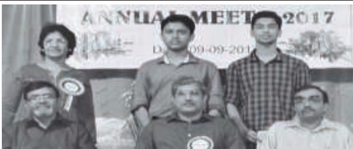
ಆಲ್ ಬ್ಯಾಂಕ್ಸ್ ಕ್ರಿಶ್ಚಿಯನ್ ಬ್ಯಾಂಕ್ ಎಂಪ್ಲೊಯಿಸ್ ಎಸೊಸಿಯೇಶನ್ (ಠಿ) ಮಂಗ್ಳುರ್ ಹಾಂಚೊ 16ವೊ ವಾರ್ಷಿಕೋತ್ಸವ್ ಬೆಂದುರ್ ಇಗರ್ಜೆಚ್ಯಾ ಮಿನಿ ಸಾಲಾಂತ್ ಆಚರಣ್ ಕೆಲೊ.