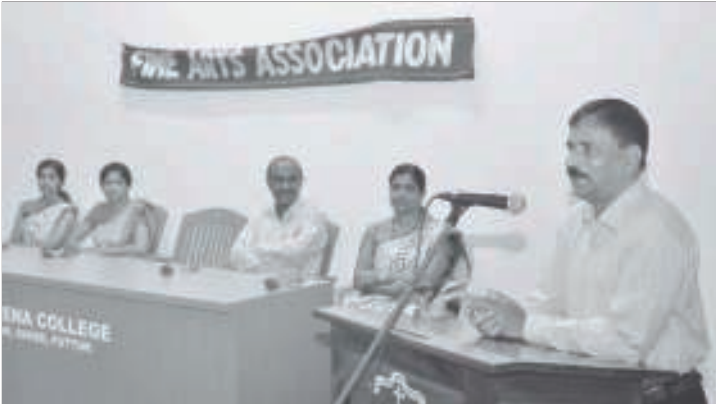
ಪುತ್ತೂರ್ ಸಾಂ ಫಿಲೊಮಿನಾ ಕೊಲೆಜಿಂತ್ 'ಆರ್ಟ್ ಆಂಡ್ ಕ್ರಾಫ್ಟ್' ಕಾಮಾಸಾಲ್ ಅಗೊಸ್ತ್ 19ವೆರ್ ಚಲ್ಲೆಂ.