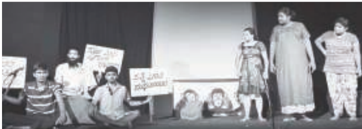
ಕಲಾಕುಲ್ ನಾಟಕ ರೆಪರ್ಟೆಚ್ಯಾ 7ವ್ಯಾ ಪಂಗ್ಡಾನ್ ಆಪ್ಲೊ ಪಯ್ಲೊ ನಾಟಕ್ - 'ಯುವರ್ ಒಬಿಡಿಯೆಂಟ್' ಸಪ್ಟೆಂಬರ್ 3ವೆರ್ ಕಲಾಂಗಣಾಂತ್ ಸಾದರ್ ಕೆಲೊ.