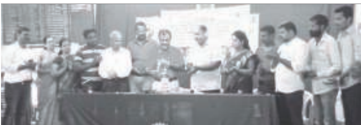
ಅಗೊಸ್ತ್ 20ವೆರ್ ಕಾರ್ಕಳ್ಚ್ಯಾ ರೋಟರಿ ಬಾಲಭವನಾಂತ್ ವಿವಿಧ್ ಸಂಘಟನಾಂಚ್ಯಾ ಮುಖೆಲ್ಪಣಾರ್ ರಕ್ತದಾನ್ ಶಿಬಿರ್ ಚಲ್ಲೆಂ.