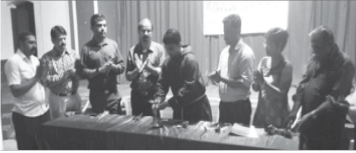
ಆಲ್ಟಿನ್ ಅಂದ್ರಾದೆ ಸಾಸ್ತಾನ್ ಹಾಚ್ಯಾ "ಕೋಣಿ ಸಮಾ ನಾಂತ್" ನಾಟಕಾಚೆಂ ಮುಹೂರ್ತ್ ಕಾರ್ಯಂ ಸಪ್ಟೆಂಬರ್ 1ವೆರ್ ಡೋನ್‌ಬೊಸ್ಕೊ ಸಾಲಾಂತ್ ಚಲ್ಲೆಂ.