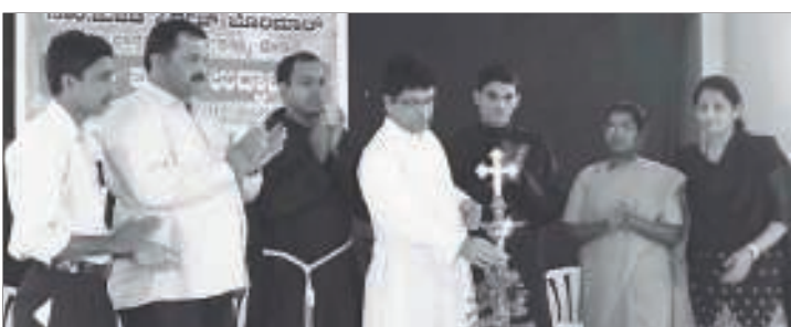
ಬೊರಿಮಾರಾಂತ್ ಸಾಂ ಫ್ರಾನ್ಸಿಸ್ ಆಸ್ಸಿಸಿಚಿ ತಿಸ್ರಿ ಒಡ್ಡ್ ಹಾಚೆಂ ನವೆ ಘಟಕ್ ಉಗ್ಡಾವಣ್ ಜಾಲೆಂ.